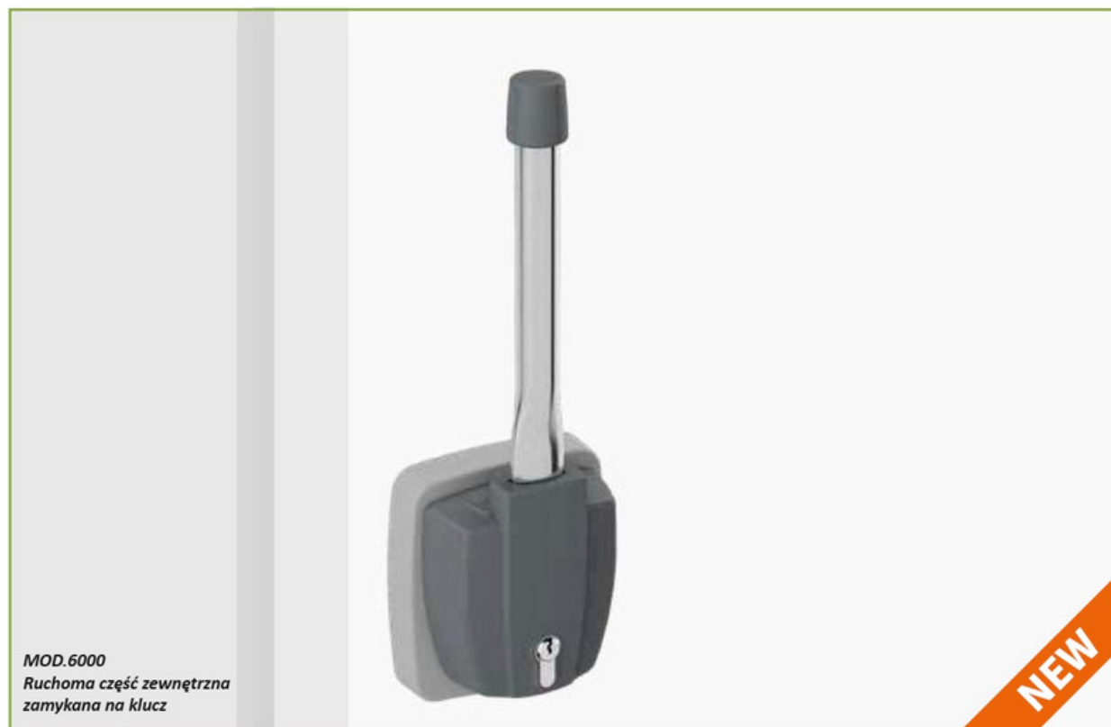
MOD. 6000 Ruchoma część zewnętrzna zamykana na klucz